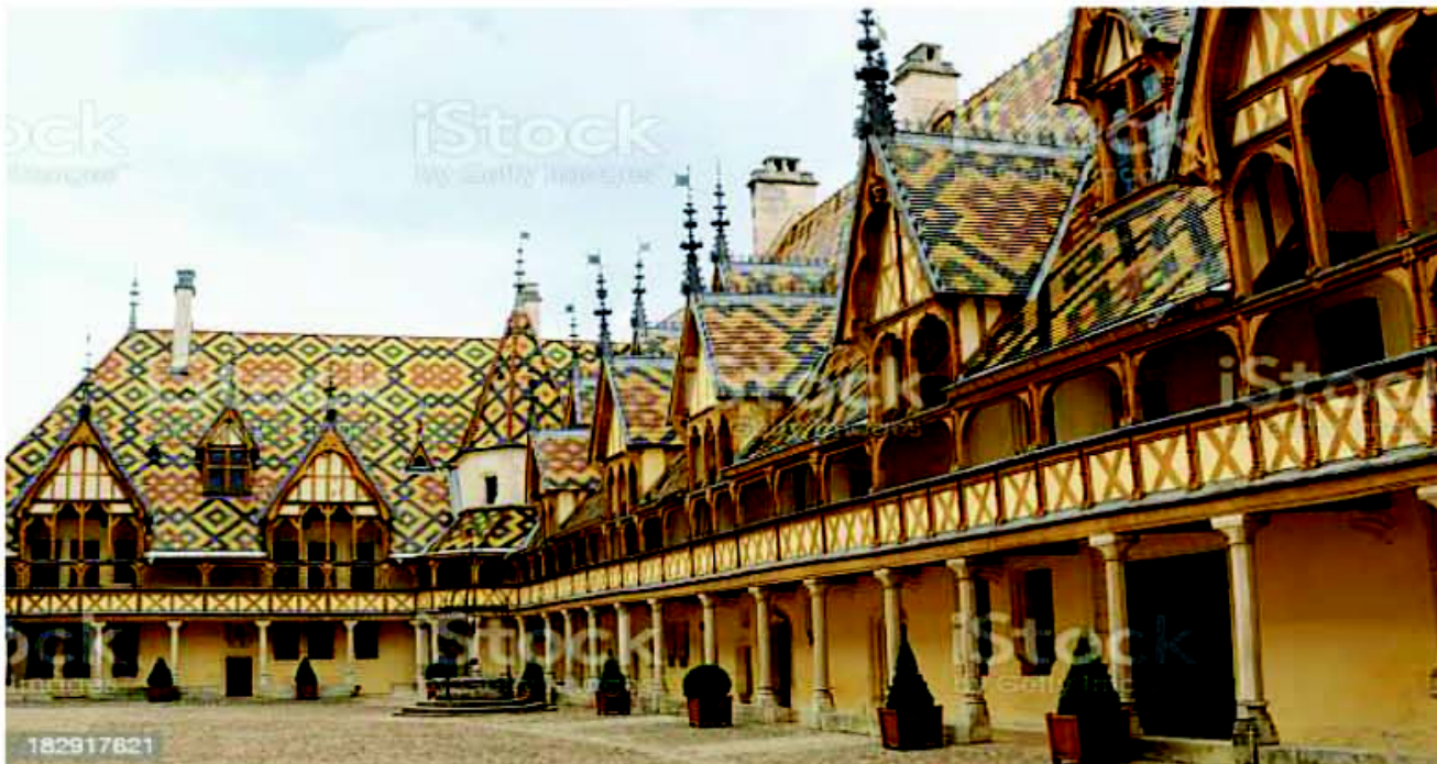
Hospices Civils de Beaune

Avec la Rando des Climats , Beaune Cyclos souhaite réunir et satisfaire le plus grand nombre de participants pour que ce rendez-vous sportif et culturel devienne incontournable.